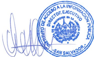
Miriam Marlene Chávez Alfaro Directora Ejecutiva Instituto de Acceso a la Información Pública

... presente transcripción es fiel y conforme con su original, el cual tuve a la vista, y para que lo proveído por este Instituto tenga su debido cumplimiento, se extiende la presente, en el Instituto de Acceso a la Información Pública, a los veinte días del mes de agosto del año dos mil veinte.